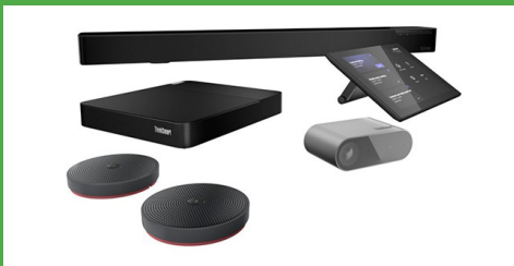
Lenovo ThinkSmart Core Full Room Kit