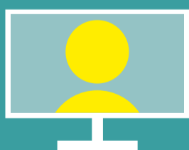
Interactief scherm (digiboard)